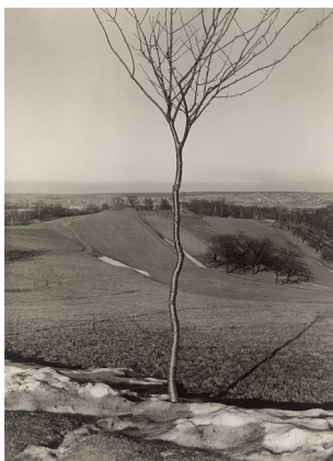
Albert Renger-Patzsch. „Das Bäumchen“. 1929 Vintage oder früher Silbergelatineabzug. Agfa-Brovira-Papier. 38,3 × 27,8 cm. EUR 60.000–80.000