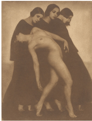
Rudolf Koppitz. Bewegungsstudie. 1925. Vintage. Mehrfacher Bromölumdruck in Braun. 38,4 × 29,5 cm (49,8 × 43,1 cm) EUR 100.000–150.000