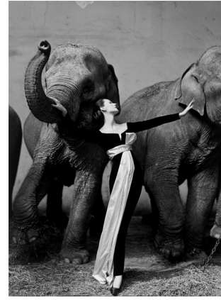
Richard Avedon. Dovima with Elephants, Evening Dress by Dior, Cirque d'Hiver, Paris. August. 1955. Silbergelatineabzug, vor 1964. 49 × 36,2 cm EUR 100.000–150.000