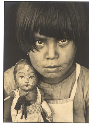
Margaret Bourke-White. Brazilian Girl, for ‚American Can Company‘. 1936. Vintage. Silbergelatineabzug. 33,8 × 24,7 cm EUR 10.000–15.000