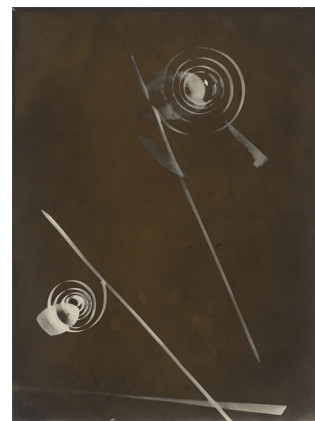
László Moholy-Nagy. „Fotogramm“. 1922 Silbergelatineabzug, Vergrößerung eines Photogramms vom Repro-Negativ, um 1929. 39,7 × 30 (39,9 × 30 cm) EUR 75.000–90.000